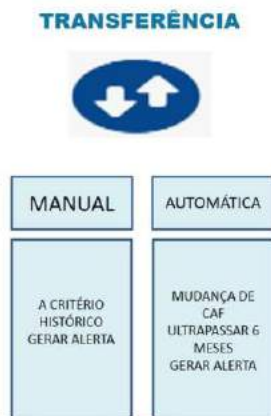
Tela 5: Exemplo de visualização da tela quando clicar na opção transferência