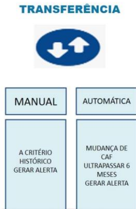
Tela 5: Exemplo de visualização da tela quando clicar na opção transferência