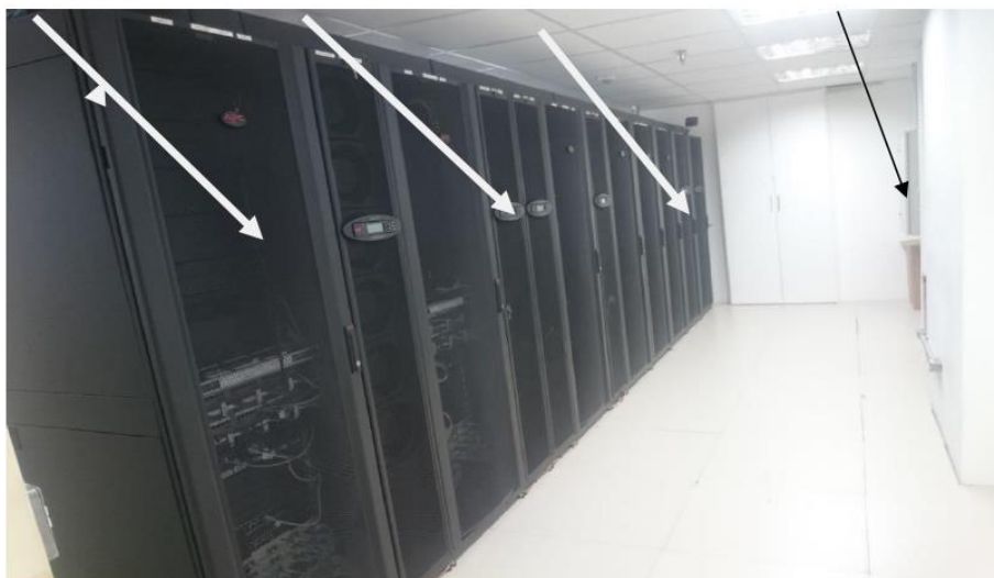
11.1.1.2 Sala de Infraestrutura Física de TI da SEFAZ/ES – Corredor de Ar Frio (SALA 1)