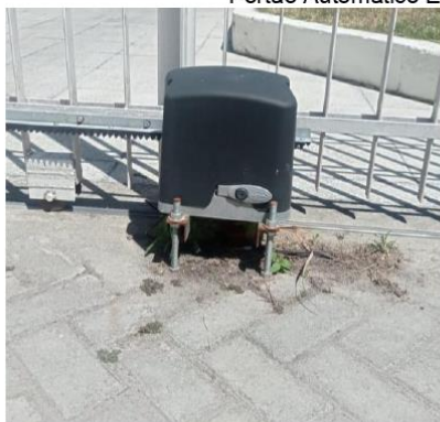
Motor do Portão Automático do Estacionamento 01