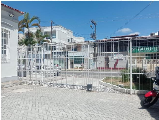
Portão Automático Estacionamento 01 – Parte Interna