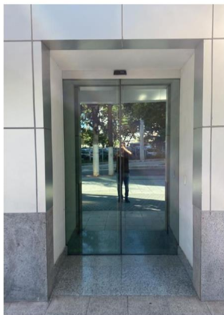
Porta Automática – Parte Externa