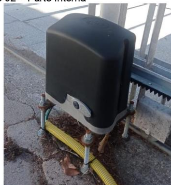
Motor do Portão Automático do Estacionamento 02