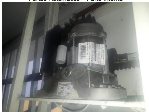
Motor do Portão Automático