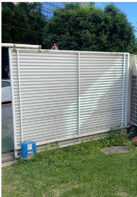
Portão Automático Área Carga e Descarga – Parte Interna