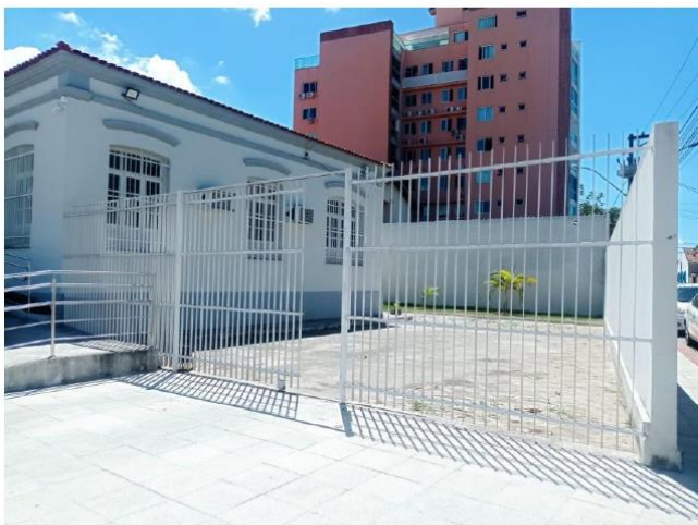
Portão Automático Estacionamento 02 – Parte Externa