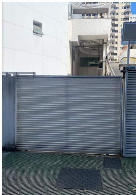
Portão Automático Área Carga e Descarga – Parte Externa