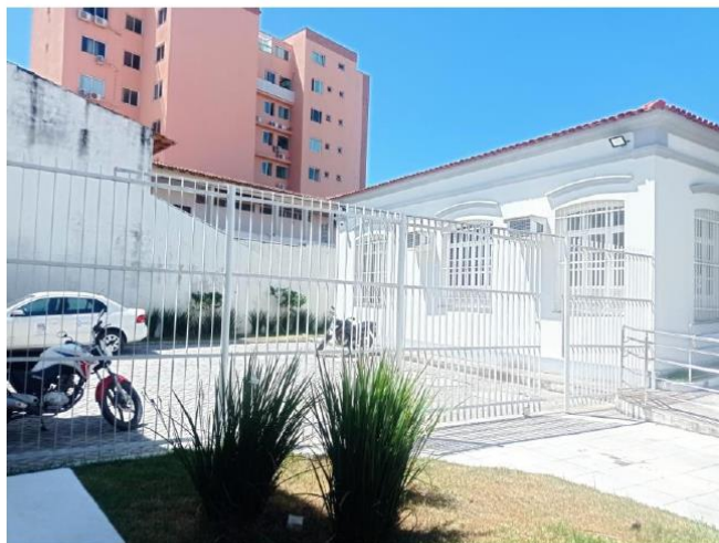
Portão Automático Estacionamento 01 – Parte Externa