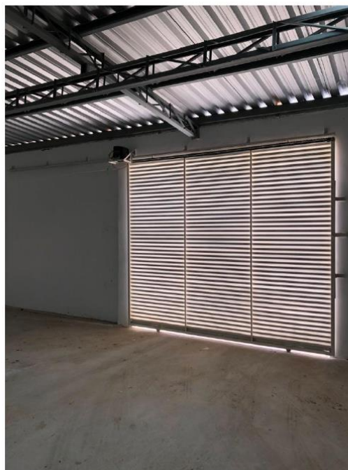
Portão Automático – Parte Interna