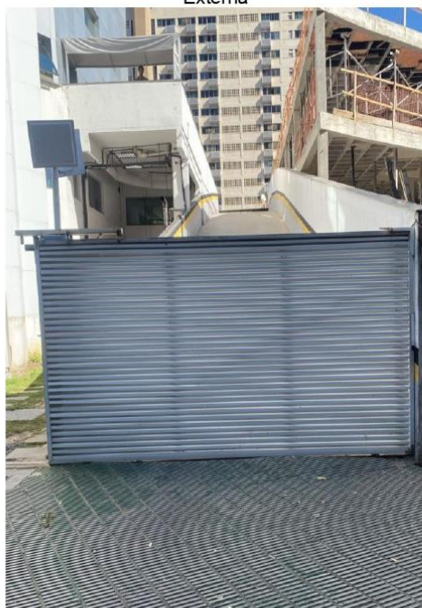
Portão Automático Acesso ao Estacionamento – Parte Externa

2023-TG8CG7 - E-DOCS - DOCUMENTO ORIGINAL 10/11/2023 16:21 PÁGINA 15 / 21