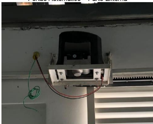
Motor do Portão Automático