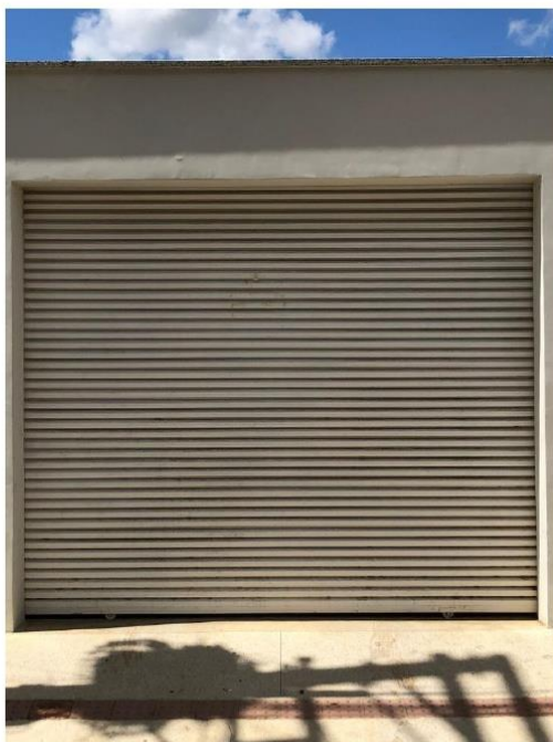
Portão Automático – Parte Externa