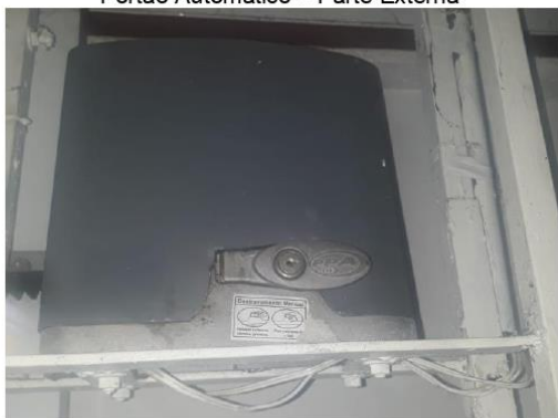
Motor do Portão Automático com Proteção