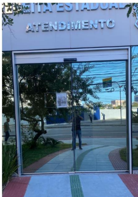
Porta Automática – Parte Externa