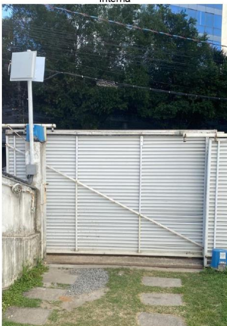
Portão Automático Acesso ao Estacionamento – Parte Interna