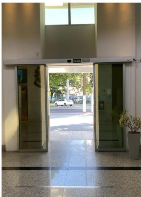
Porta Automática – Parte Interna