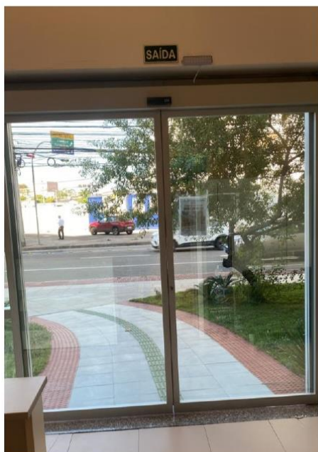
Porta Automática – Parte Interna