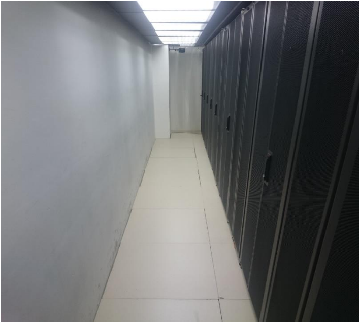
Sala de Infraestrutura Física de TI da SEFAZ/ES – Corredor de Ar Quente (SALA 1)