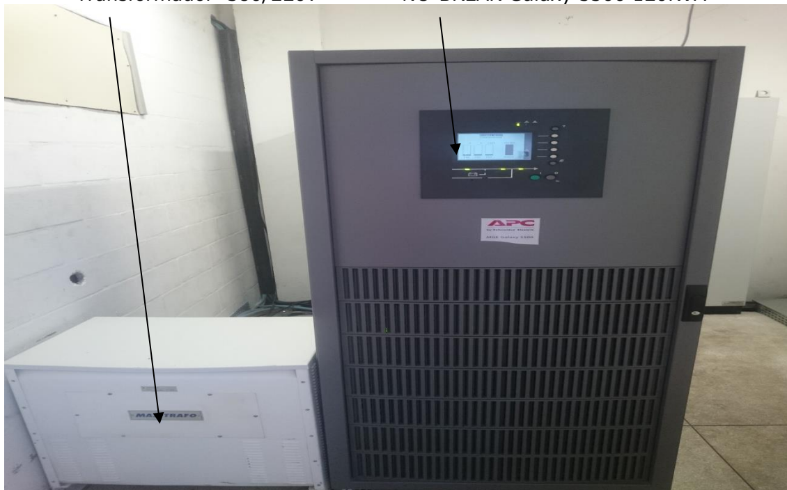
Sala de Infraestrutura Física de TI da SEFAZ/ES - (SALA 2).

Armário Metálico com 30 Baterias 100AH/12V