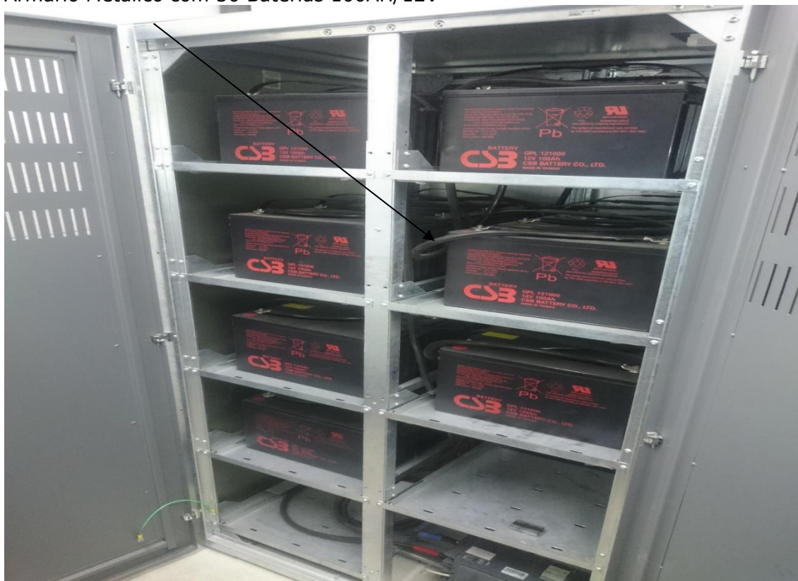
Sala de Infraestrutura Física de TI da SEFAZ/ES - (SALA 2).

Armário Metálico com 30 Baterias 100AH/12V