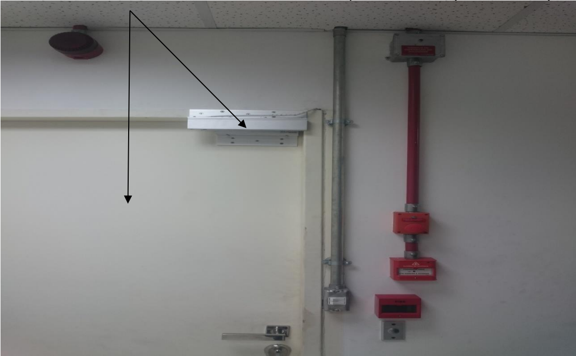
Sala de Infraestrutura Física de TI da SEFAZ/ES - (SALA 1).