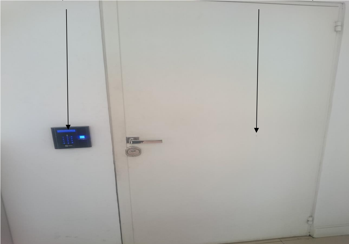
Sala de Infraestrutura Física de TI da SEFAZ/ES - (SALA 1).