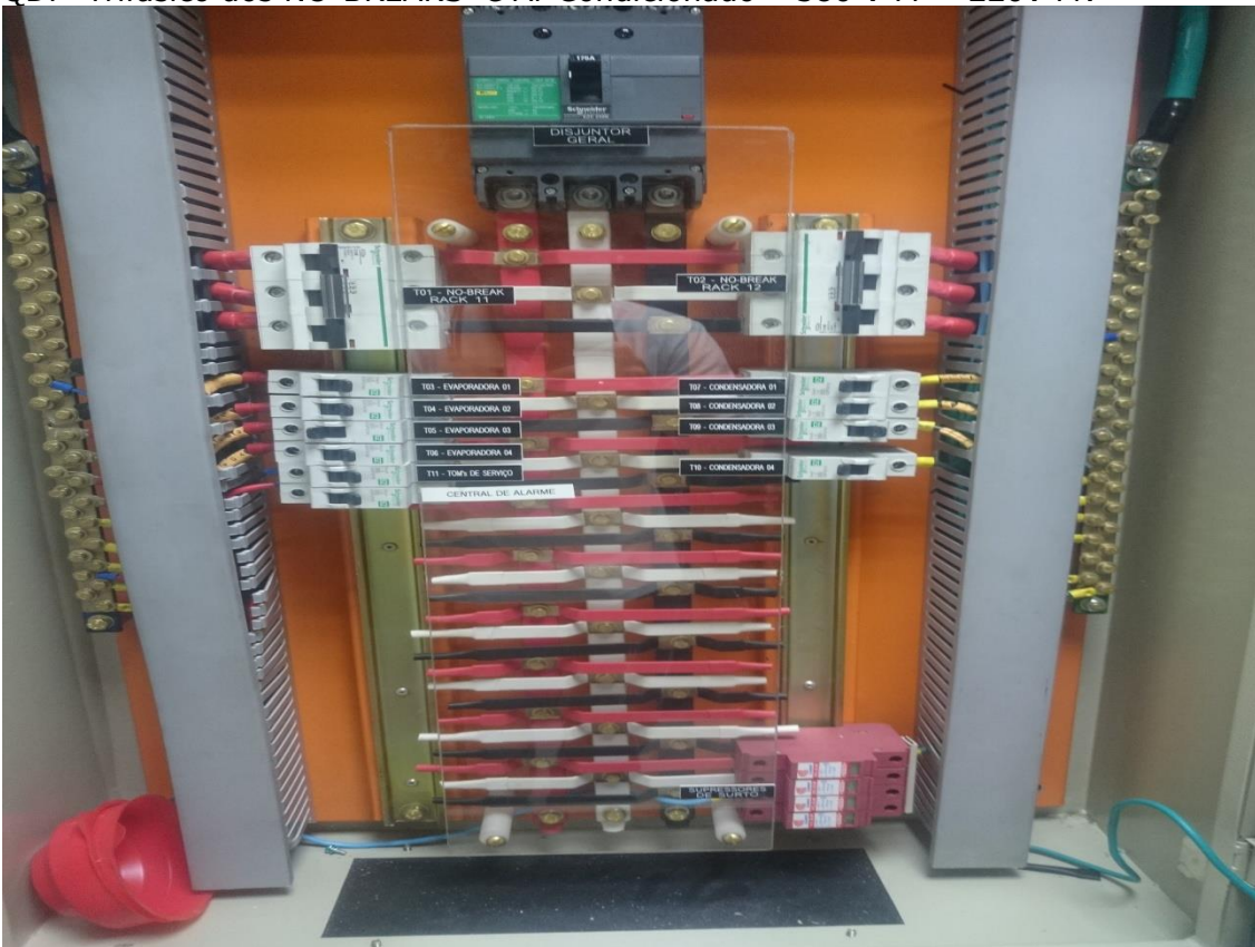
Sala de Infraestrutura Física de TI da SEFAZ/ES - (SALA 1).

QDF Trifásico dos NO-BREAKS e Ar Condicionado – 380 V FF – 220V FN