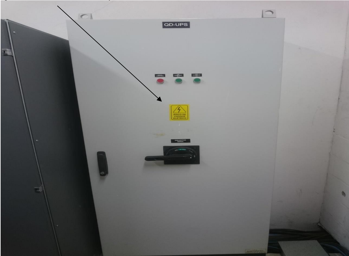
Sala de Infraestrutura Física de TI da SEFAZ/ES - (SALA 2).