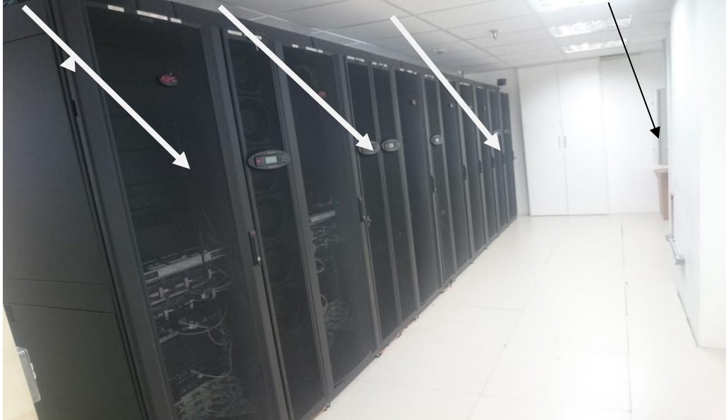
Sala de Infraestrutura Física de TI da SEFAZ/ES – Corredor de Ar Frio (SALA 1)

Rack Ar Condicionado Symmetra PX /Baterias Hot Swap 9AH/12V Painel Elétrico