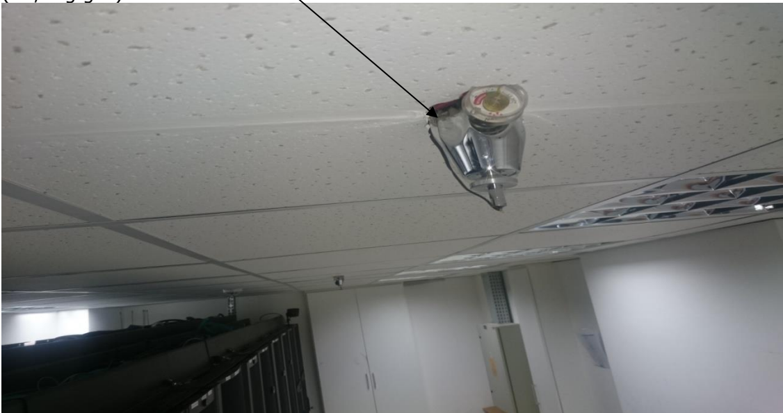
Sala de Infraestrutura Física de TI da SEFAZ/ES - (SALA 1).

Difusor e Manômetro da Unidade de Combate a Incêndio – Supressão por Gás HFC-227ea (22,5Kg gás)