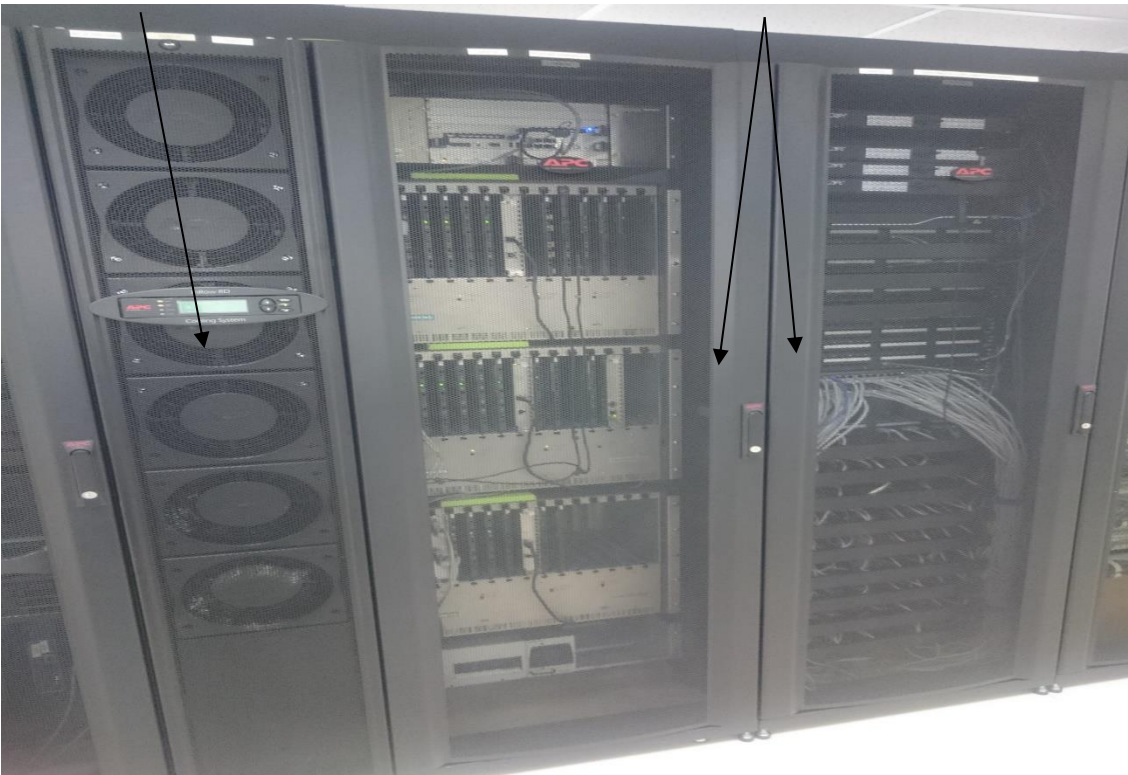
Sala de Infraestrutura Física de TI da SEFAZ/ES – Corredor de Ar Quente (SALA 1)